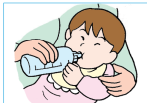
③ 薬を飲ませたあとは、水またはぬるま湯を与える。