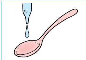
① スプーンに薬を取り、水またはぬるま湯を加える。