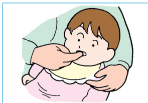
② ダンゴ状にしたものを指先につけ、上顎にこすりつける。