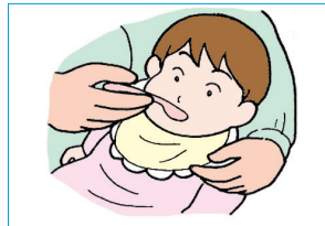
③ 混ぜたものを、そのままスプーンで静かに飲ませる。