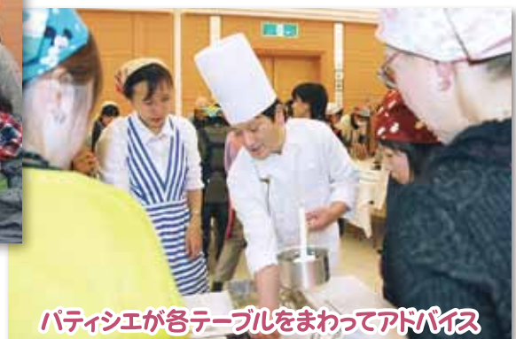
パティシエが各テーブルをまわってアドバイス