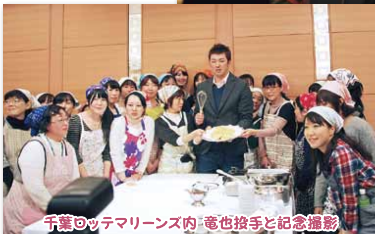
千葉ロッテマリーンズ内 竜也投手と記念撮影