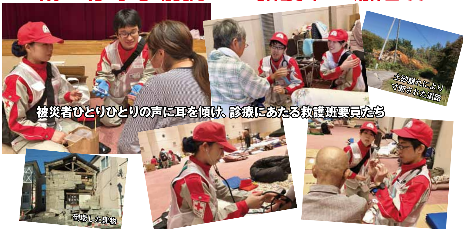
被災者ひとりひとりの声に耳を傾け、診療にあたる救護班要員たち

9月6日、北海道で最大震度7を観測する地震が発生し、土砂崩れや家屋の倒壊、液状化現象、大規模停電等大きな被害をもたらしました。