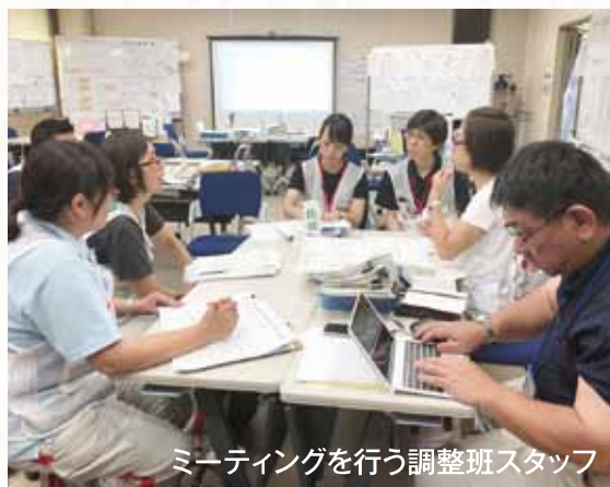
ミーティングを行う調整班スタッフ

スタッフによるハンドマッサージを受けた被災者の表情が徐々に和らいでいく様子や、行政職員等支援者たちが疲弊している姿を間近で見て、こころのケアの必要性を強く感じたそうです。