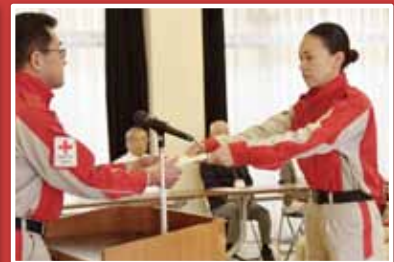
任命書交付のようす