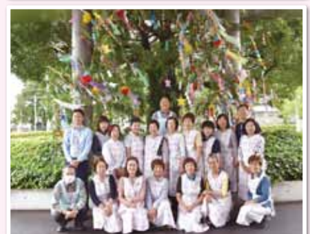
30名で仲良く活動しています