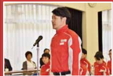
救護班代表による決意表明