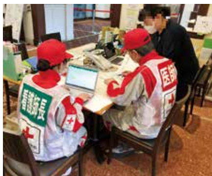
県職員と連携し活動を開始する医療救護班