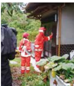
一軒一軒民家を訪問する救護班