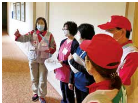
県職員に導線についてアドバイスを行う看護師長