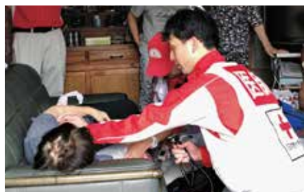
体調の悪い被災者を診察する医師

また、当院を含む県内外の赤十字救護班が参集し、被害の大きかった安房地域で避難所や住宅を回り、体調面に不安を持つ被災者一人一人に声をかけながら健康状態の確認や診療等を行いました。