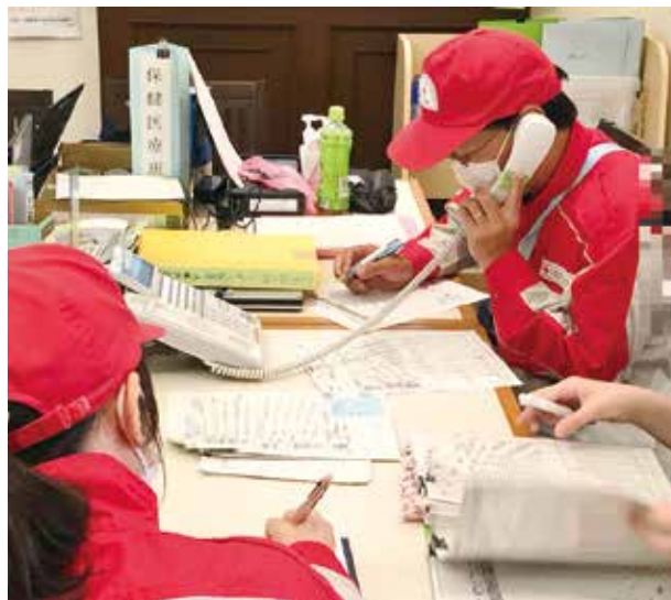
電話での問診を行う医師

7月20日以降は再び医療救護班を派遣し、継続して入所者への電話診療や現地で活動しているスタッフの健康チェックを行い、派遣が終了した12月30日までに延137名が活動を行いました。