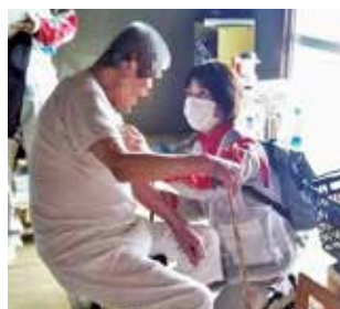
停電する住宅で生活する高齢者へケアを行う看護師