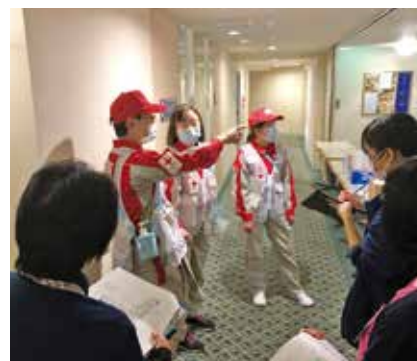
施設内のエリア分けをする救護班