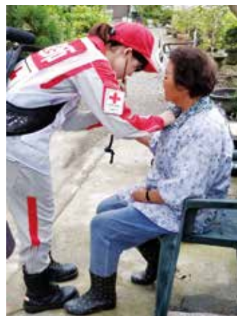
看護師による聴診を行う看護師