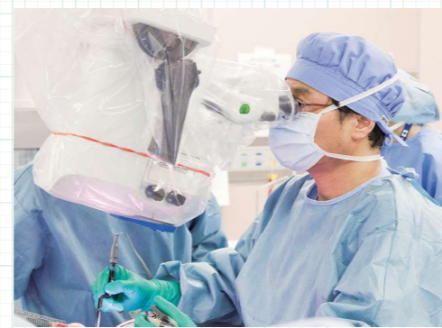
脳神経外科研修指導責任者