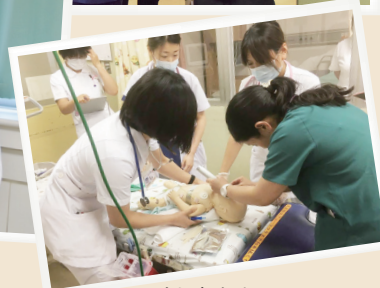
小児急変時シュミレーション