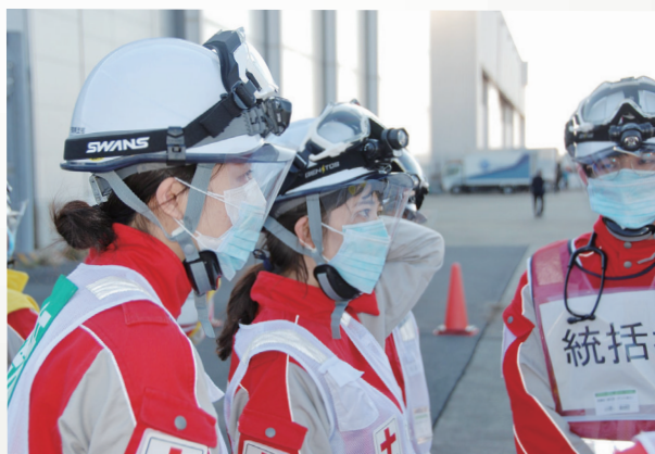
航空機事故消火救難総合訓練