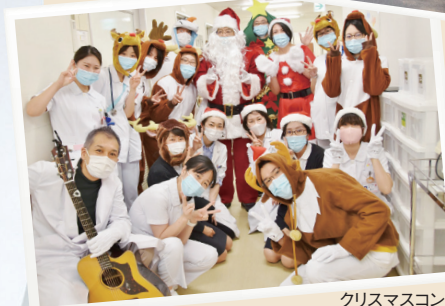
クリスマスコンサート