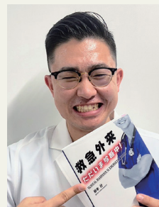
2年次初期臨床研修医

この病院にて後悔した瞬間は1秒もありません!誰よりもどこよりも充実した熱い2年間をお約束しますので、ぜひ皆様一緒に働きましょう!!!